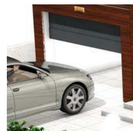
Porte de garage